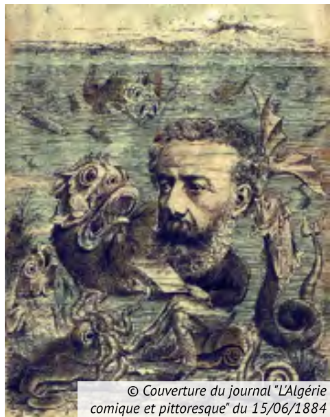
© Couverture du journal "L'Algérie comique et pittoresque" du 15/06/1884