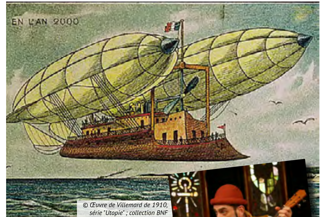
© Œuvre de Villemard de 1910, série "Utopie" ; collection BNF

Vincent, conteur, lecteur, est parti à la poursuite des héros de Jules Verne sur terre, sur mer et dans les airs pour ravir vos oreilles pendant la dégustation d'une soupe chaude.